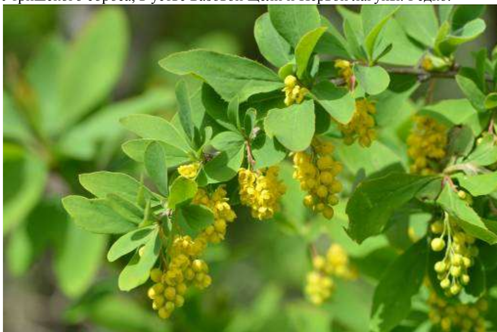
Рисунок 22. Berberis vulgaris L.