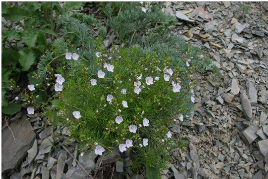
Рисунок 48. Veronica filifolia Lipsky