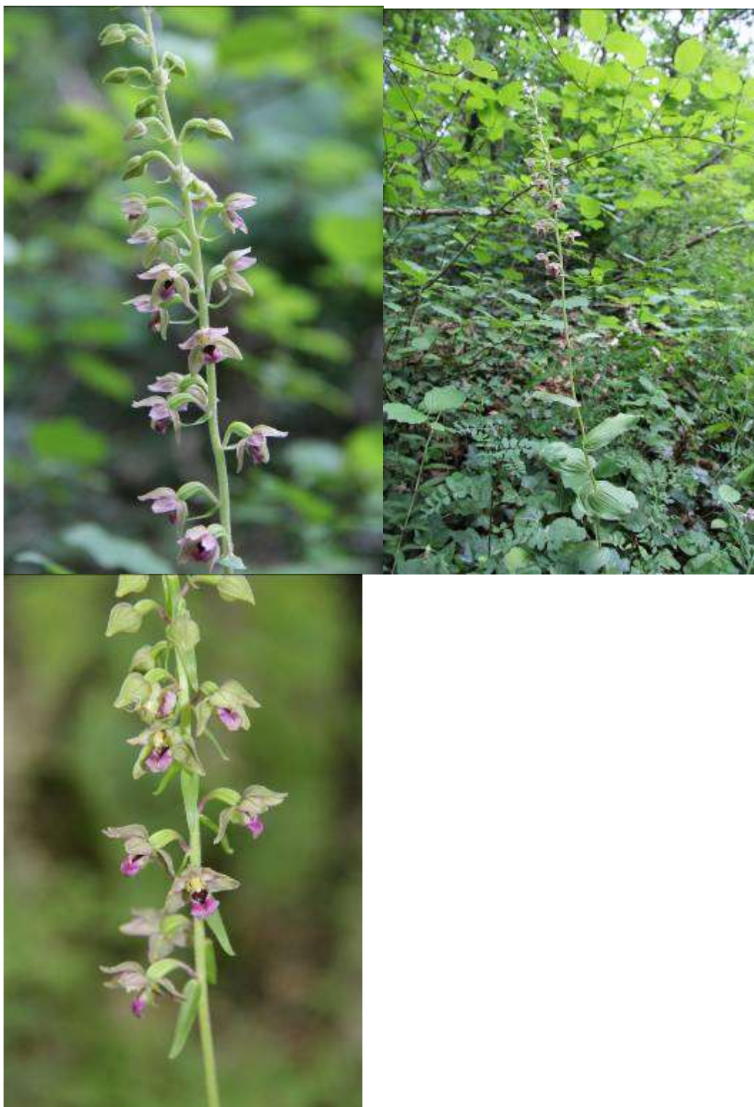
Рисунок 13. Epipactis helleborine (L.) Crantz