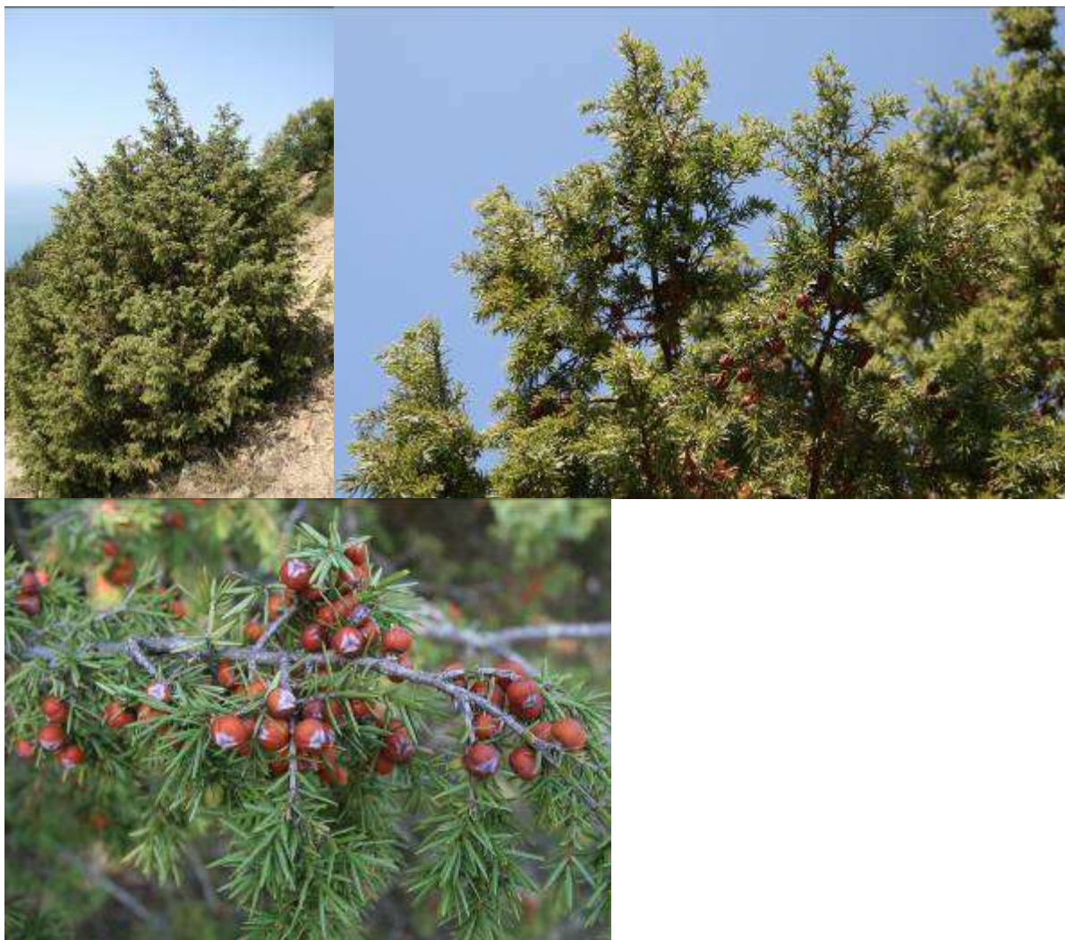
Рисунок 4. Juniperus oxycedrus L.