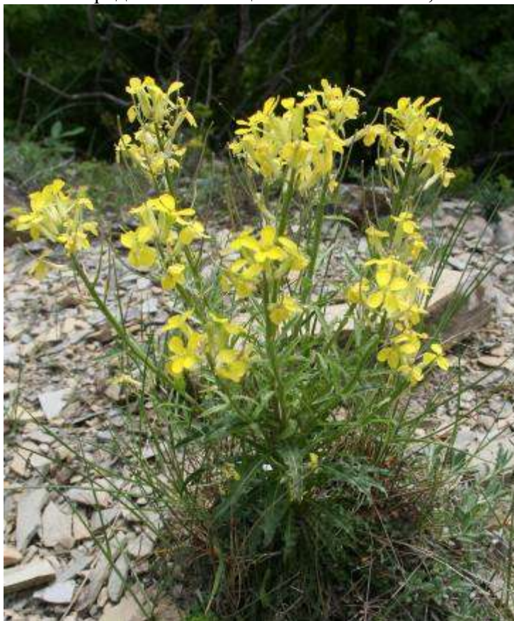
Рисунок 27. Erysimum callicarpum Lipsky