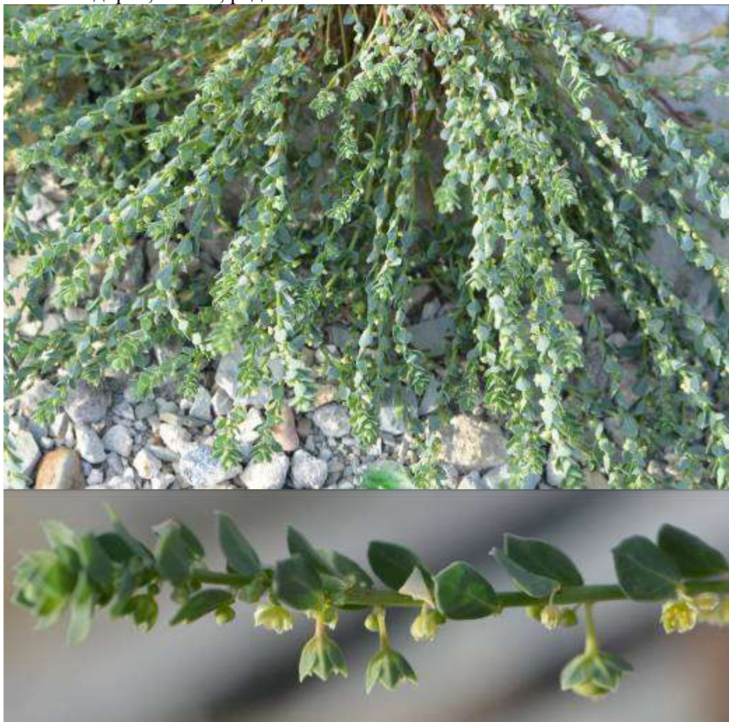
Рисунок 39. Andrachne telephioides L.

512. Andrachne telephioides L. – Андрахна телефиевидная (рис. 39). Щебнистые склоны и обочины дорог, осыпи, редколесья. Часто.