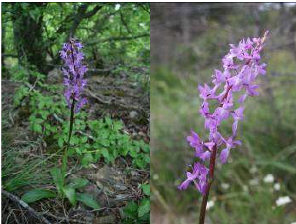
Рисунок 18. Orchis mascula L.