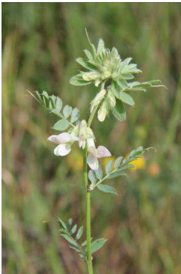
Рисунок 37. Vicia pannonica Crantz