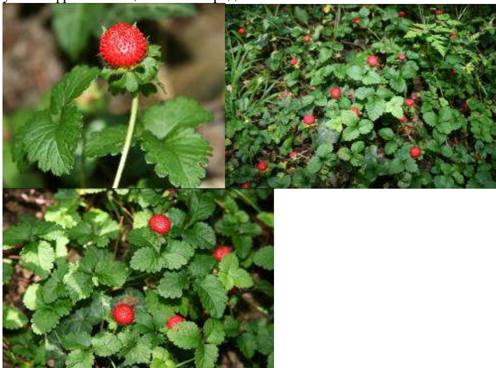
Рисунок 31. Duchesnea indica (Andr.) Focke