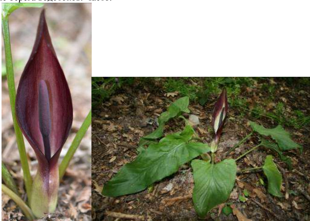
Рисунок 6. Arum orientale Vieb.