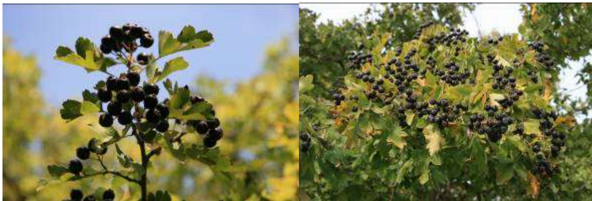
Рисунок 30. Crataegus pentagyna Waldst. & Kit.