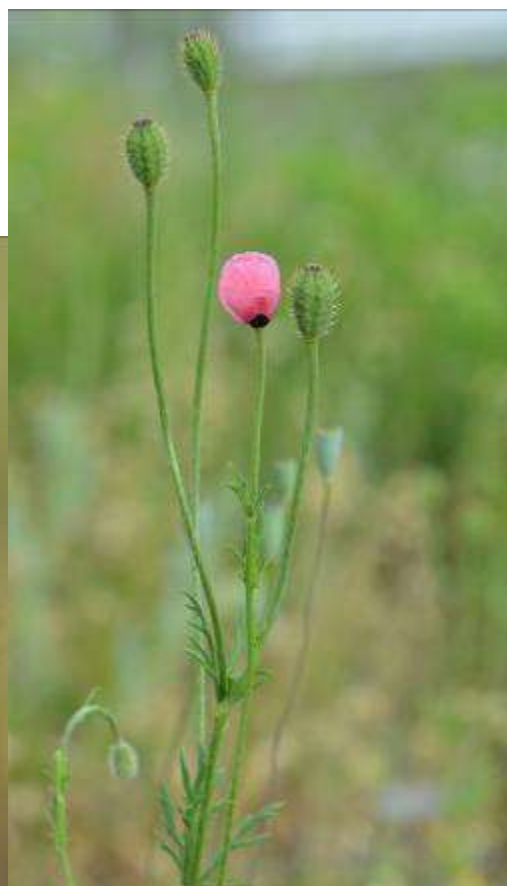
Рисунок 24. Papaver hybridum L.