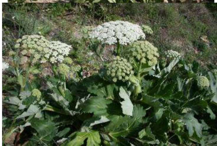
Рисунок 42. Heracleum stevenii Manden.