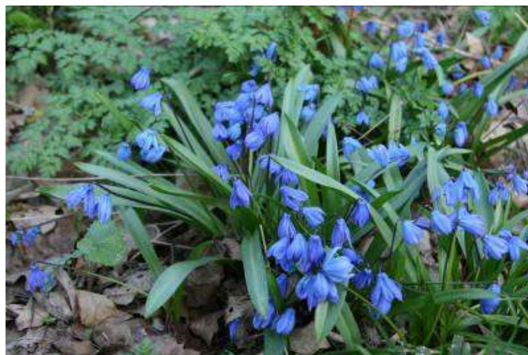
Рисунок 9. Scilla sibirica Haw.