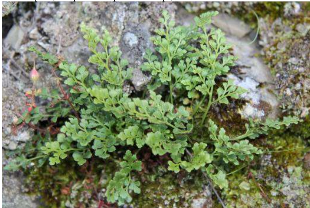
Рисунок 1. Asplenium ruta-muraria L.