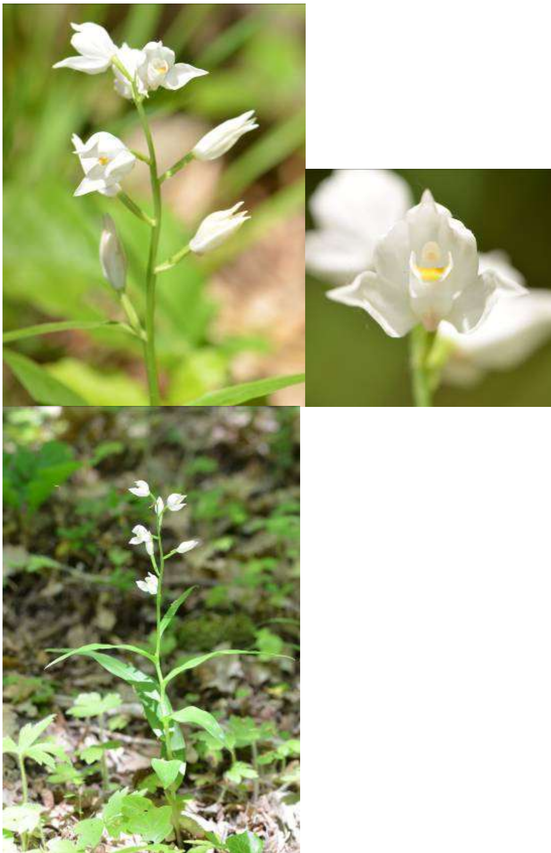
Рисунок 11. Cephalanthera longifolia (L.) Fritsch