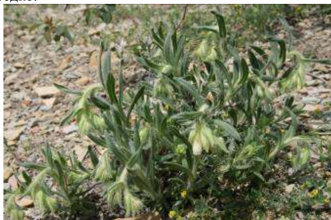
Рисунок 45. Onosma rigida Ledeb.