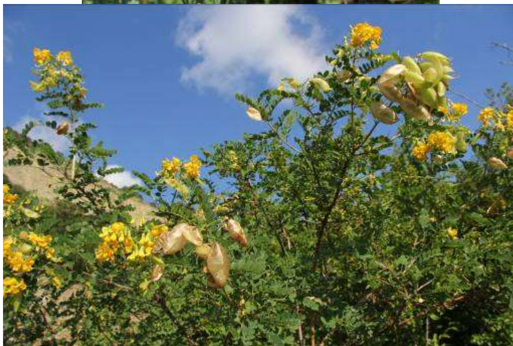
Рисунок 33. Colutea cicilica Boiss. & Bal.