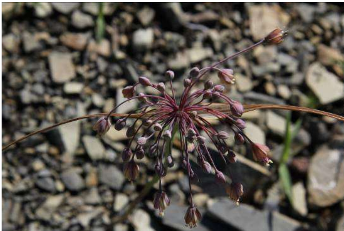
Рисунок 7. Allium paniculatum Tuzs.