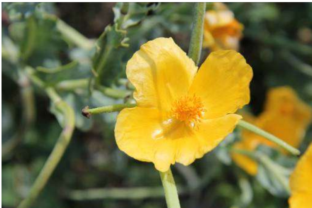
Рисунок 23. Glaucium flavum Crantz