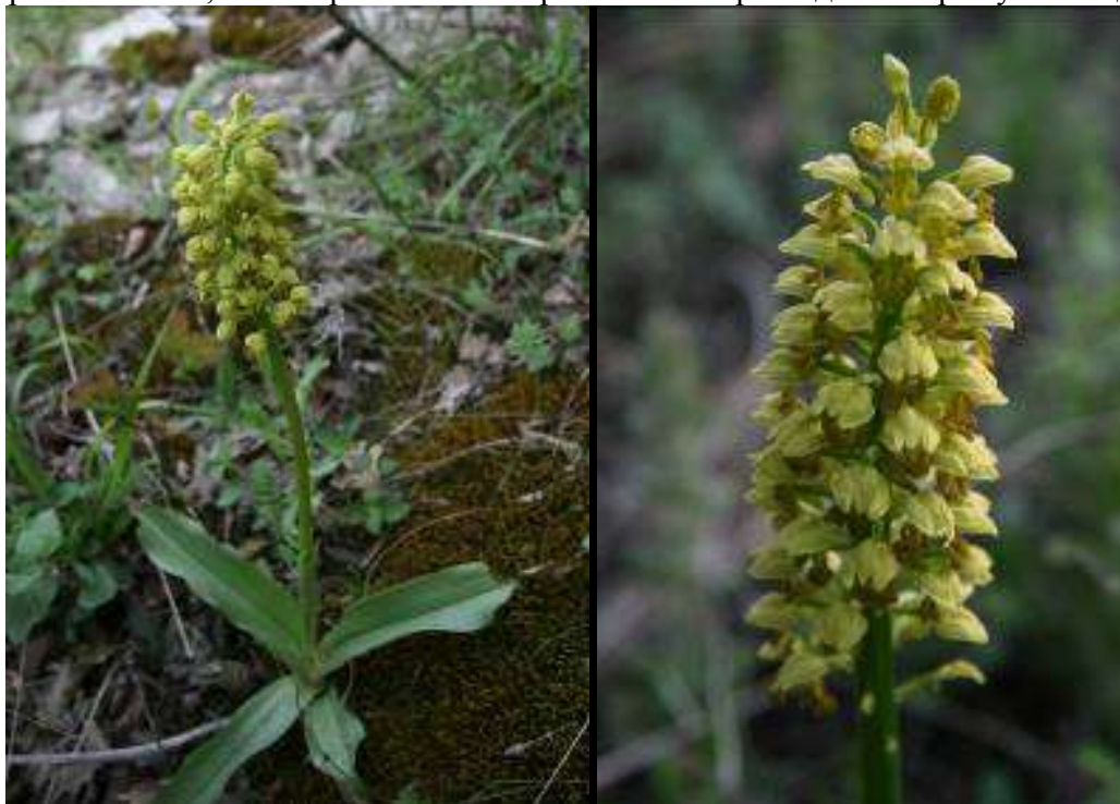
Рисунок 19. Orchis punctulata Stev. ex Lindl.