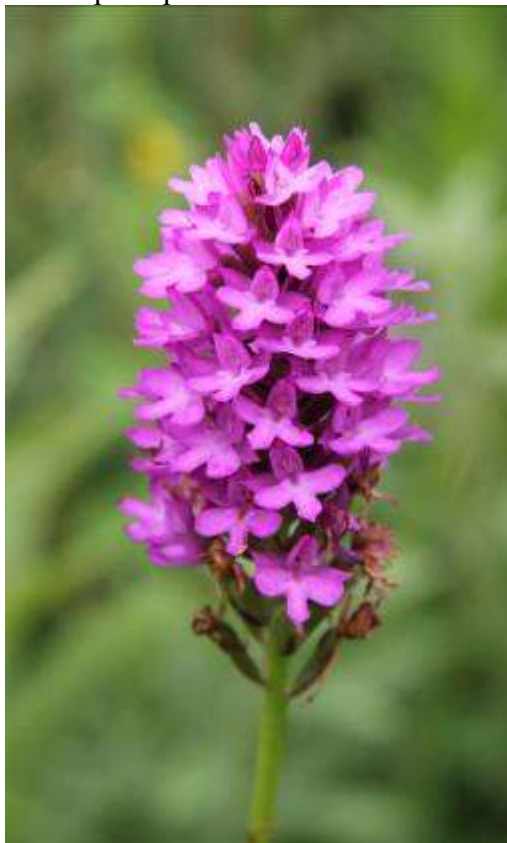
Рисунок 10. Anacamptis pyramidalis (L.) Rich.