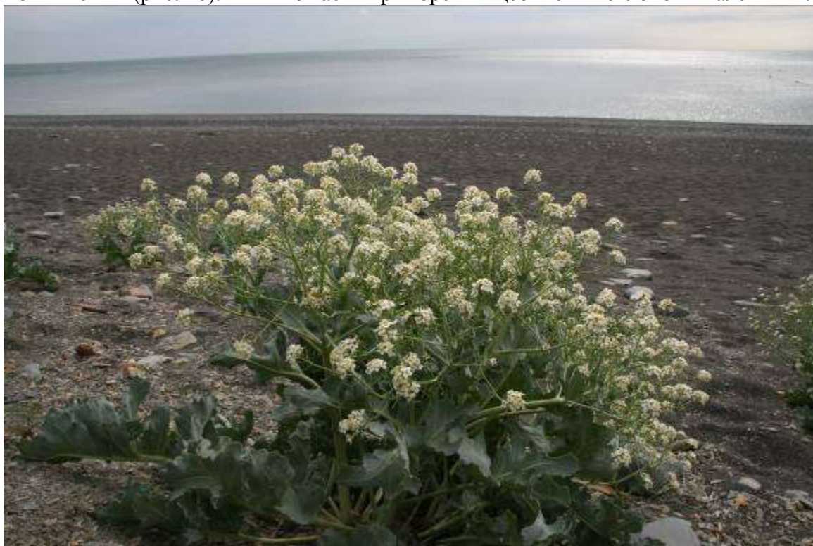
Рисунок 26. Crambe maritima L.