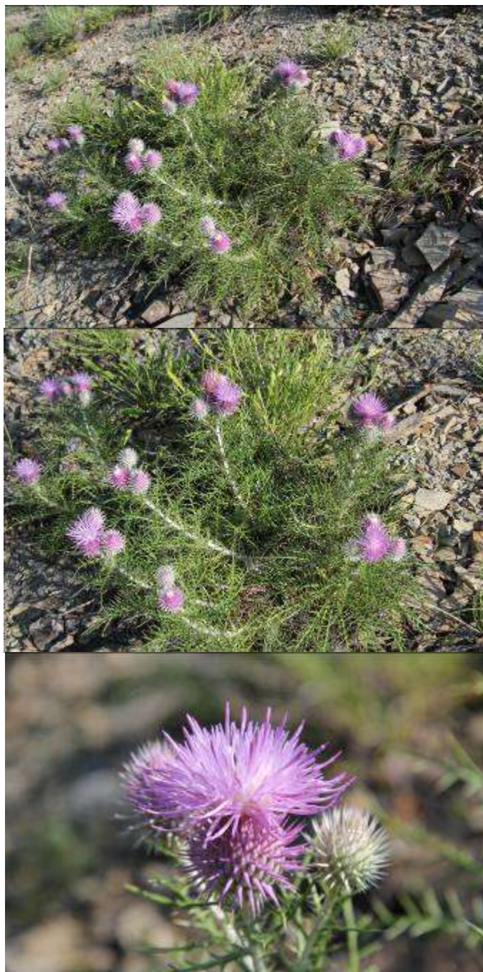
Рисунок 50. Lamyra echinocephala (Willd.) Tamamsch.