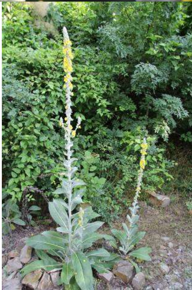
Рисунок 47. Verbascum gnaphalodes M. Bieb.