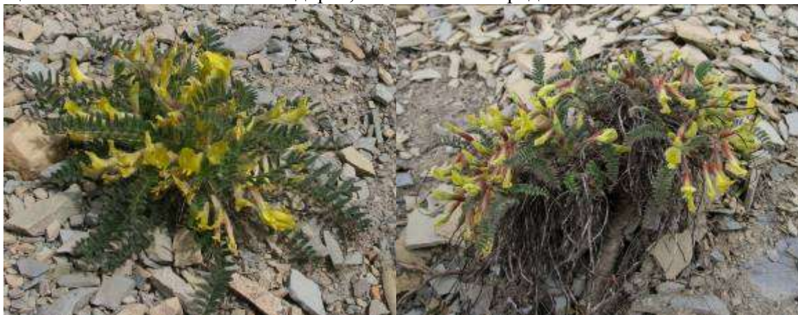
Рисунок 32. Astragalus utriger Pall.