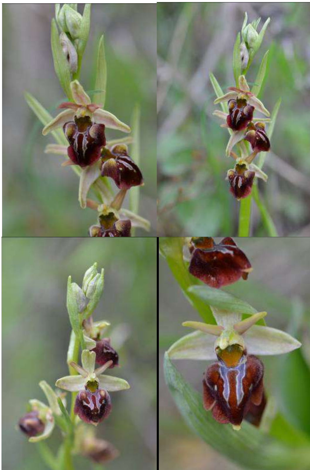
Рисунок 16. Ophrys caucasica Woronow ex Grossh.