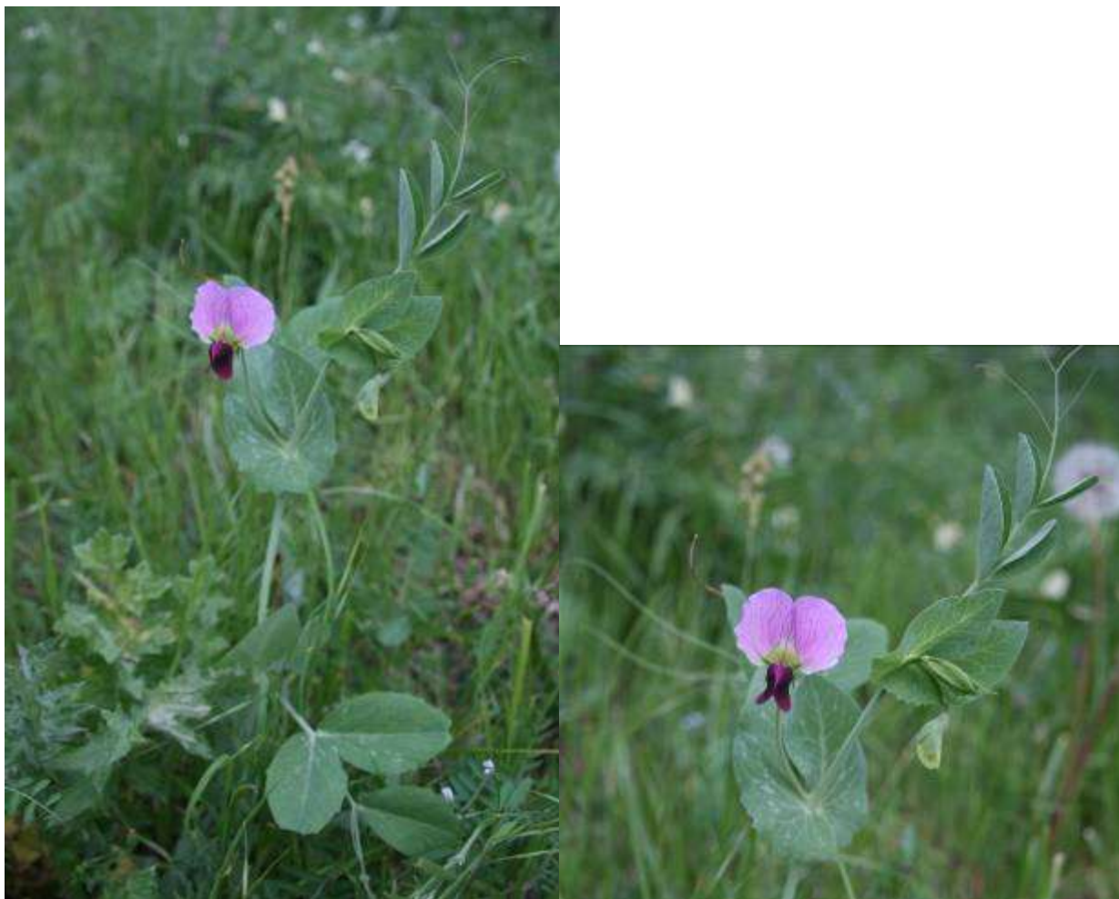
Рисунок 36. Pisum elatius Vieb.