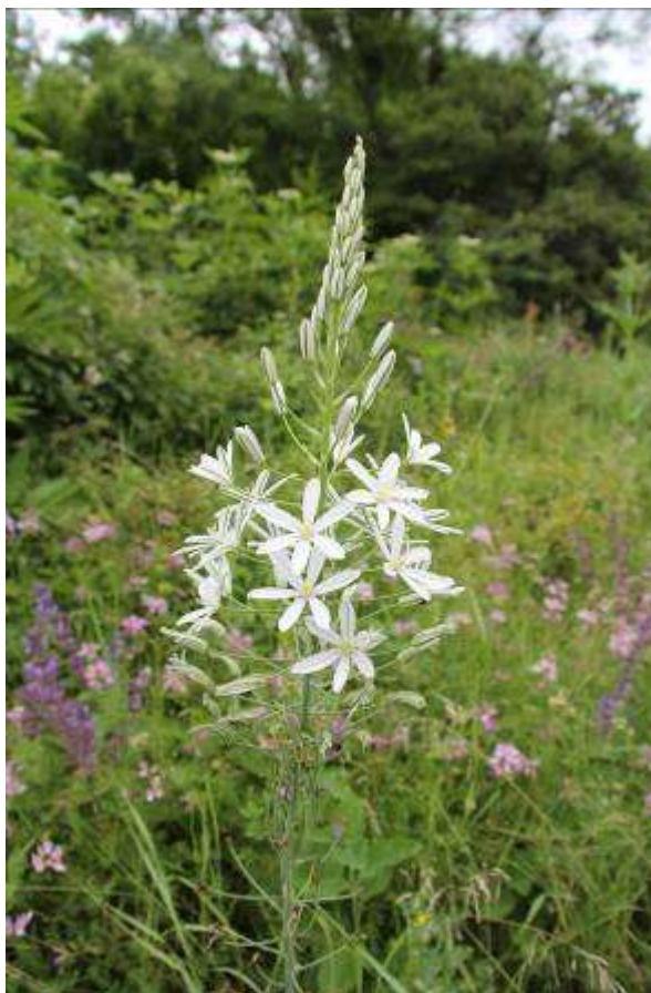
Рисунок 8. Ornithogalum ponticum Zahar.