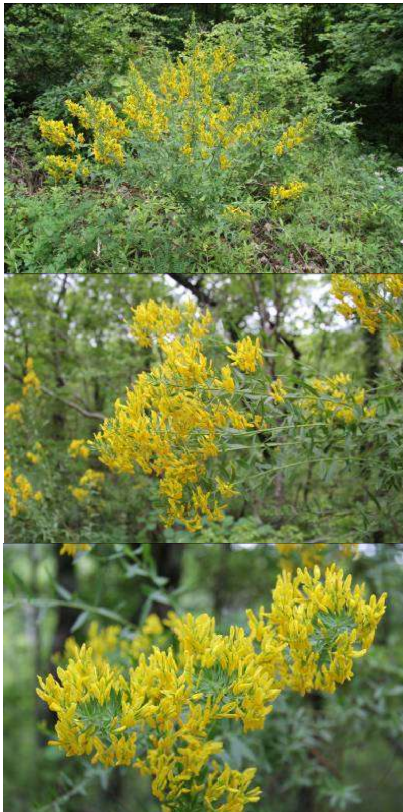
Рисунок 34. Genista patula Vieb.