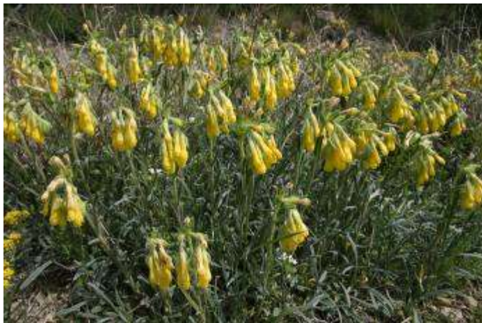
Рисунок 46. Onosma taurica Pall. ex Willd.