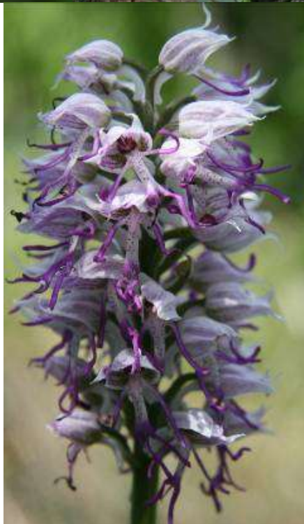
Рисунок 21. Orchis simia Lam.