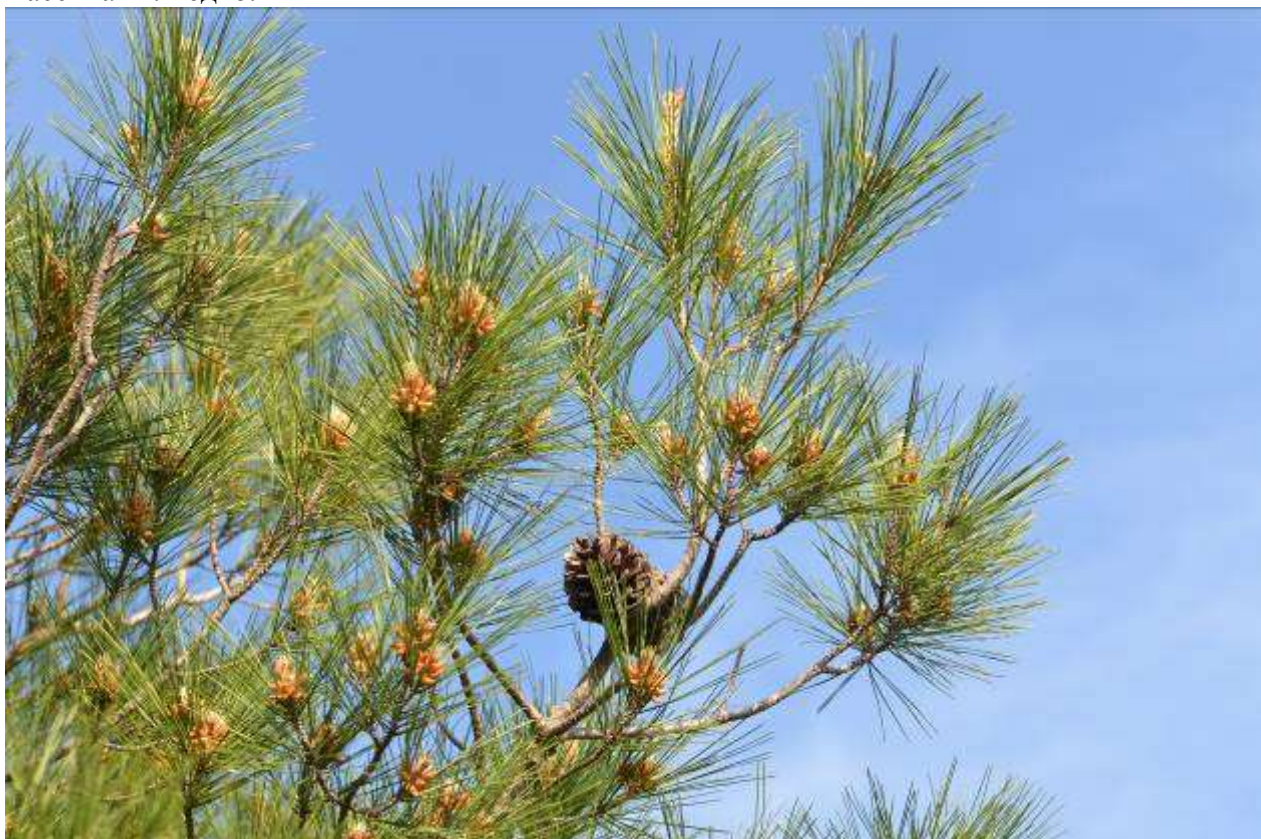
Рисунок 2. Pinus pityusa Stev.