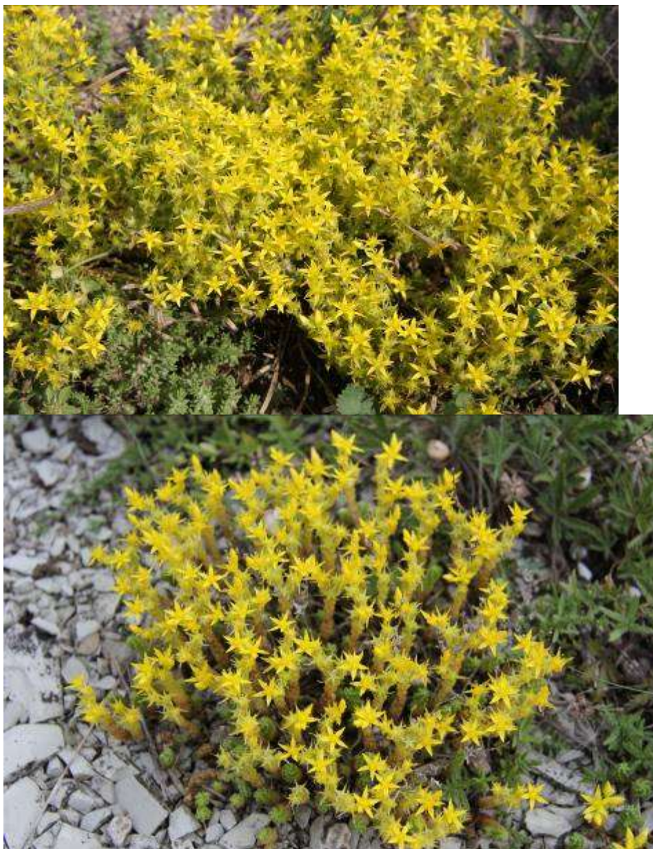
Рисунок 28. Sedum acre L.