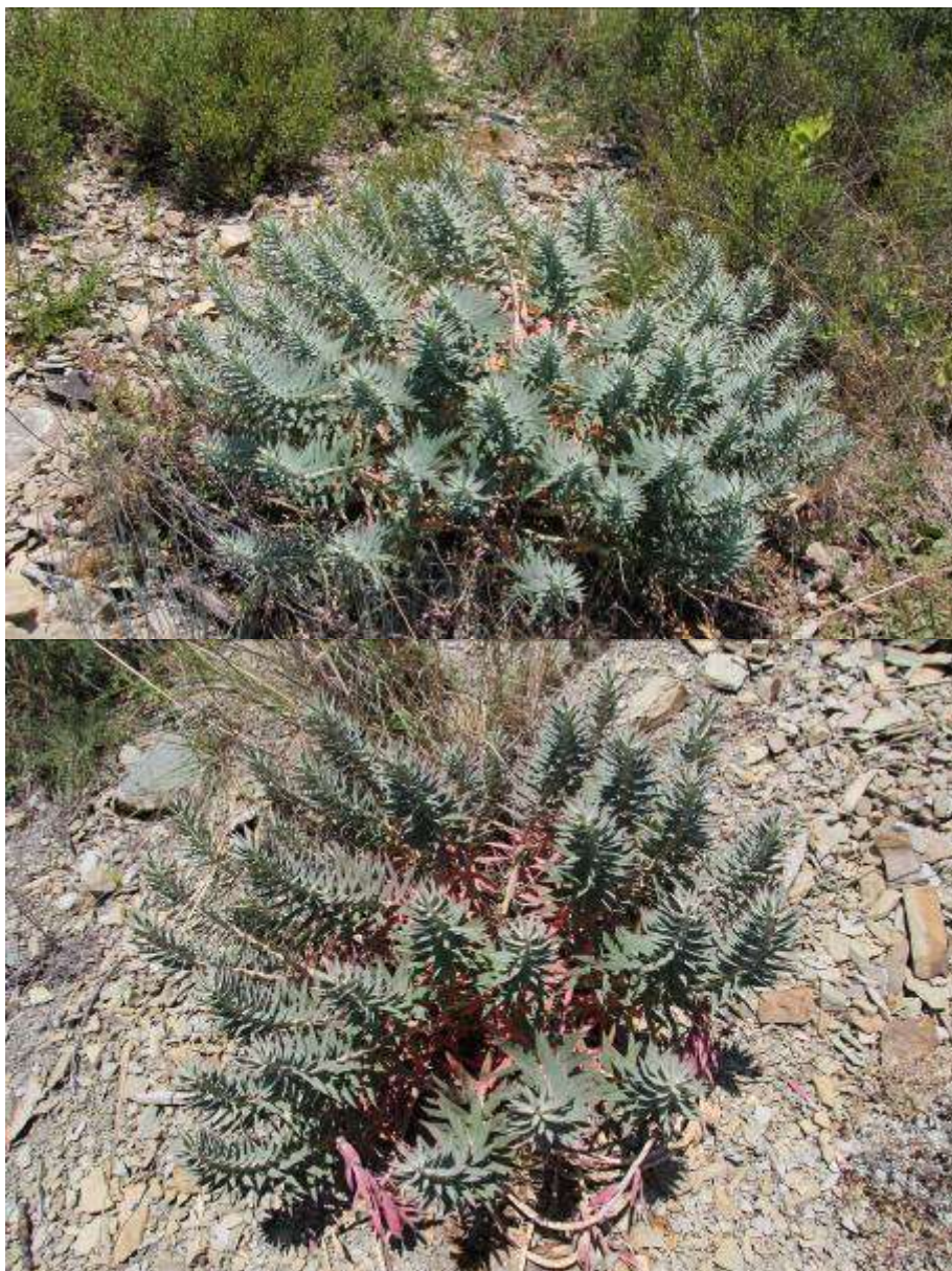
Рисунок 40. Euphorbia rigida Vieb.