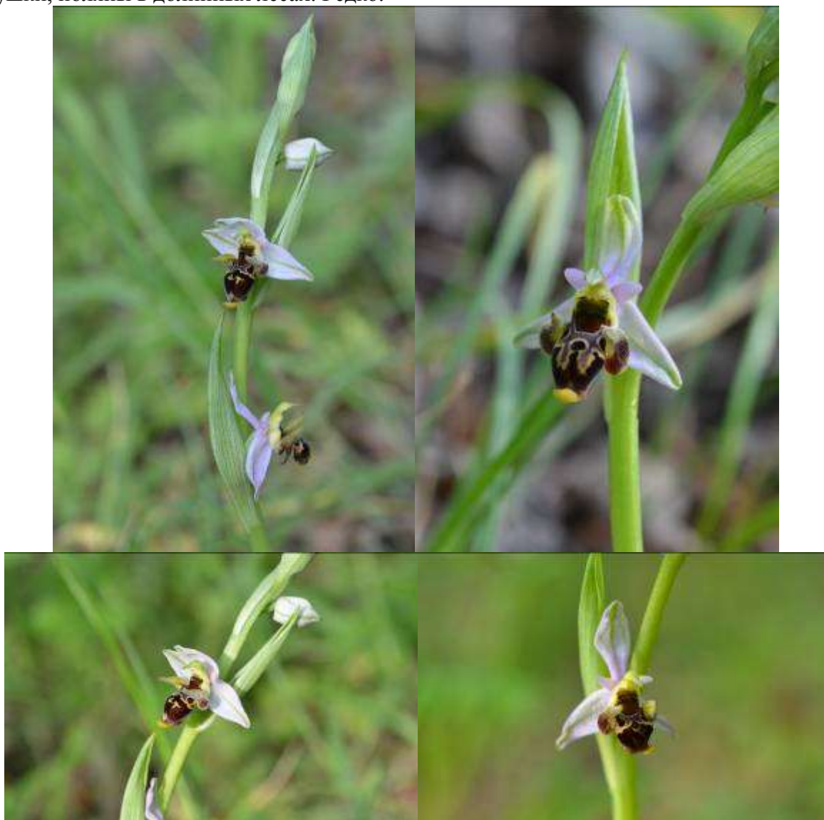
Рисунок 17. Ophrys oestrifera Vieb.