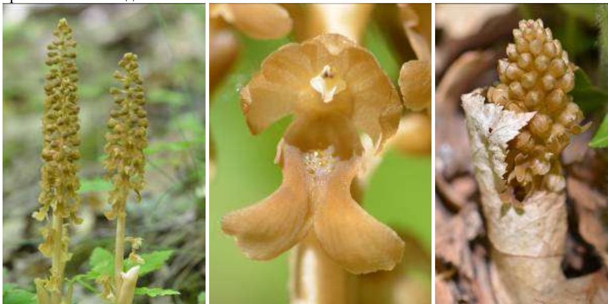
Рисунок 15. Neottia nidus-avis (L.) Rich.