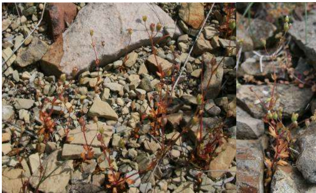
Рисунок 29. Saxifraga tridactylites L.