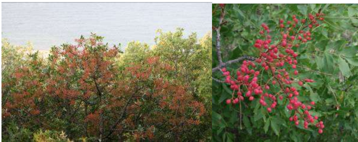
Рисунок 41. Pistacia mutica Fisch. & C.A. Mey