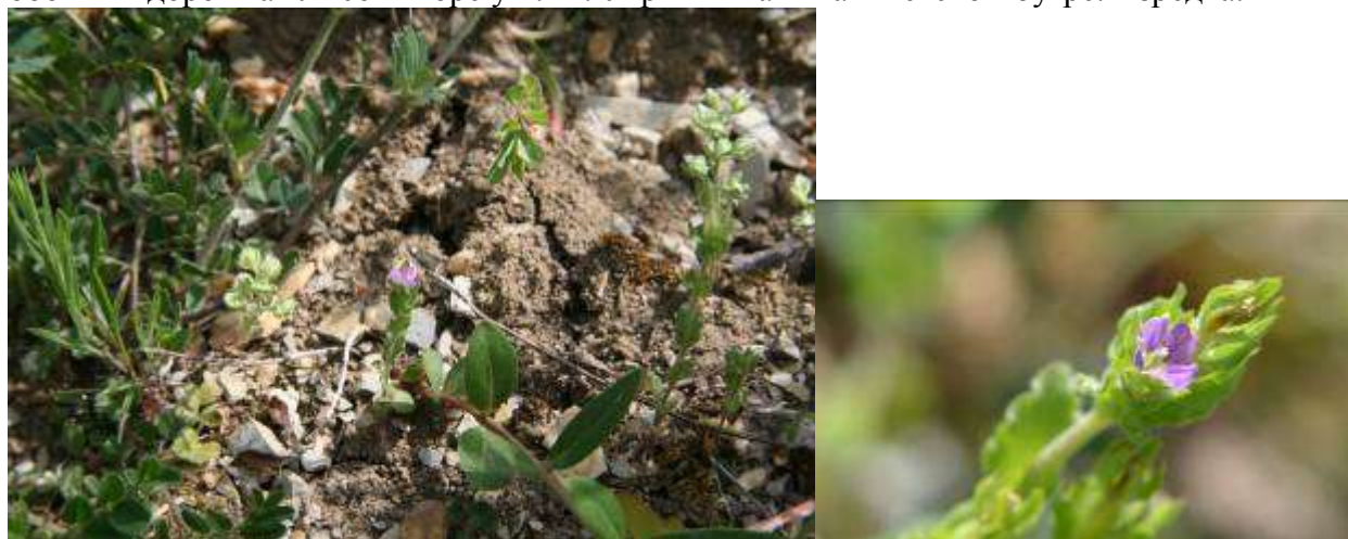
Рисунок 49. Legousia hybrida (L.) Delarbre