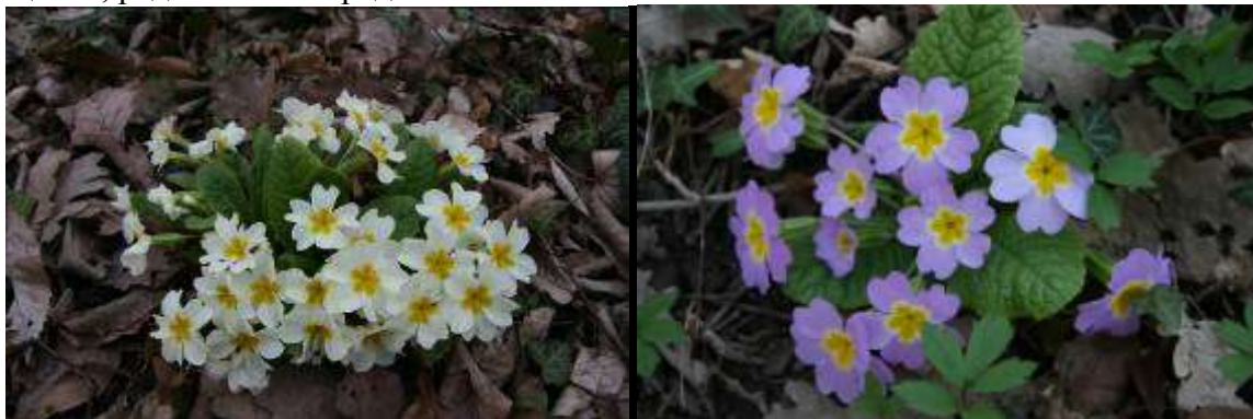
Рисунок 43. Primula acaulis L.