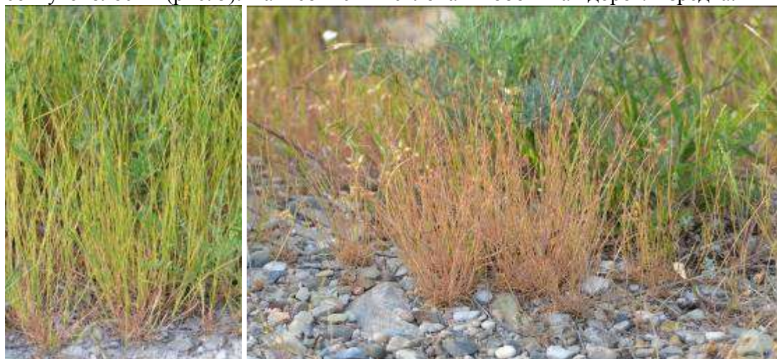
Рисунок 5. Psilurus incurvus (Gouan) Schinz et Thell.