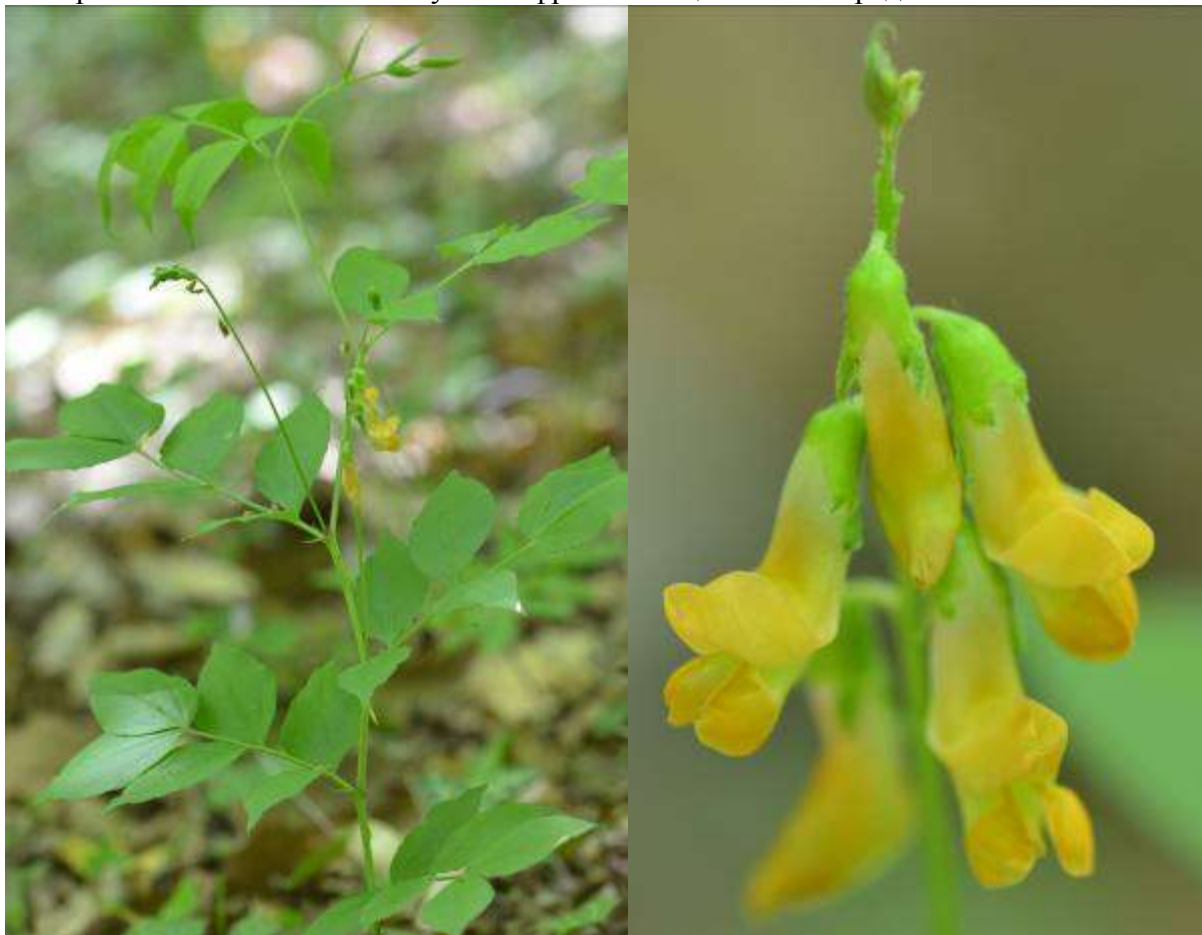
Рисунок 35. Lathyrus aureus (Steven ex Fisch. & C.A. Mey.) D. Brand