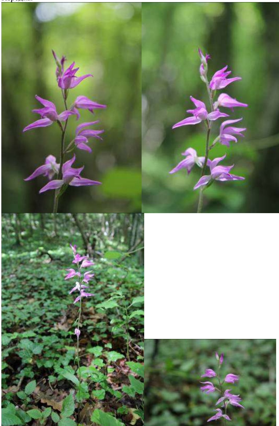
Рисунок 12. Cephalanthera rubra (L.) Rich.