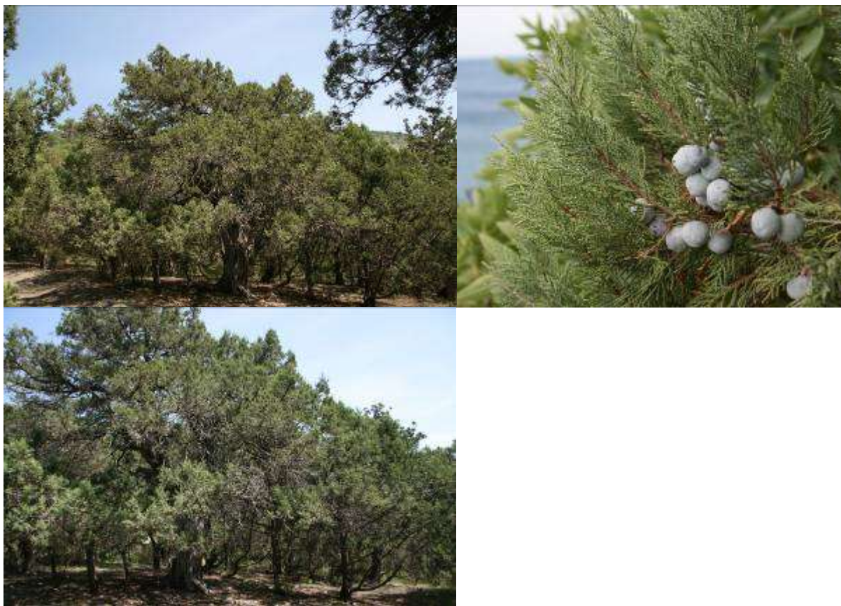
Рисунок 3. Juniperus exelsa Bieb.