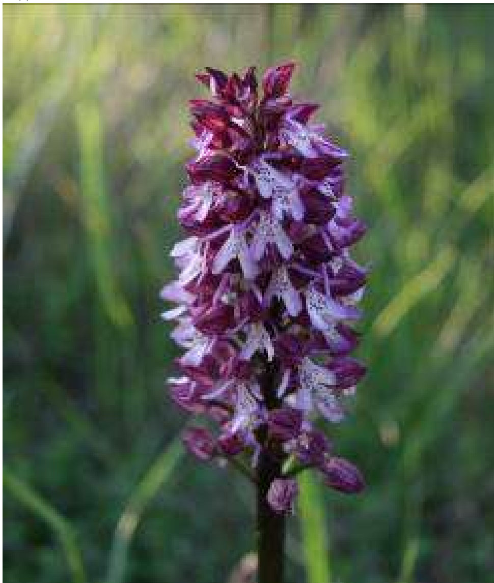
Рисунок 20. Orchis purpurea Huds.