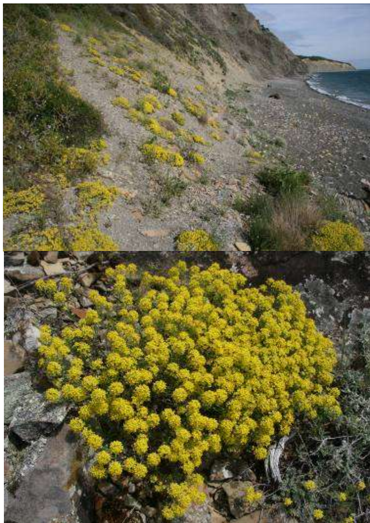
Рисунок 25. Alyssum obtusifolium Stev. ex DC.